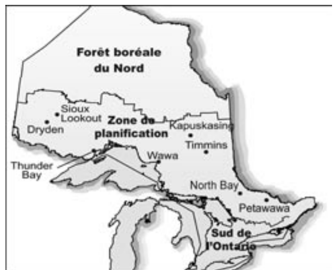
Figure 1. L'emplacement des ensembles expérimentaux NEBIE en Ontario.